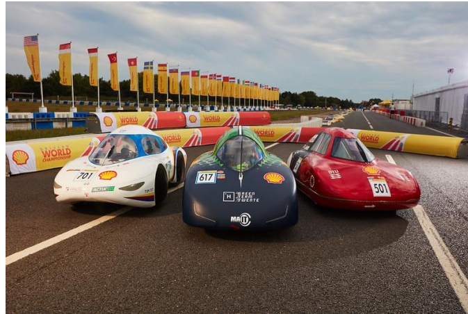
Les voitures des trois équipes qui se retrouvent chez Ferrari cette semaine.

Cet événement qui va regrouper les trois meilleures équipes du monde est l'opportunité pour Ferrari et Shell de recruter des jeunes talents. L'équipe espère pouvoir placer au moins un des élèves-ingénieurs en fin d'études chez l'écurie dans les prochaines années.