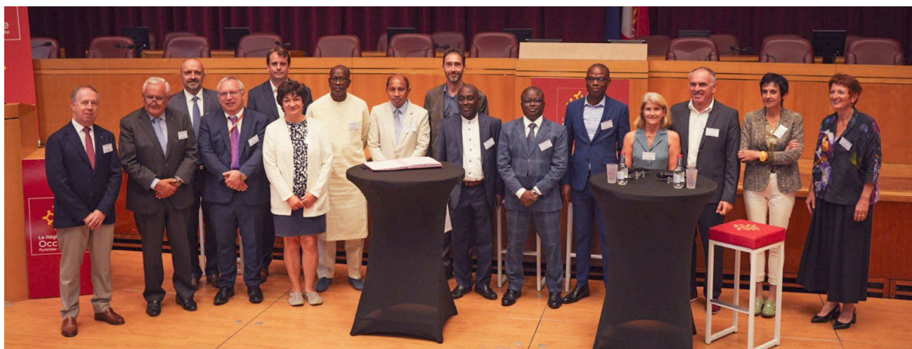
Représentants franco-africains du partenariat IDBio

Ce lundi 25 septembre 2023 à l'Hôtel de Région Occitanie, en présence de tous les partenaires académiques africains et français, et de M. Jean-Pierre Raffarin, président de la Fondation Prospective & Innovation, ancien Premier Ministre et Membre Honoraire du Parlement et de représentants de la Région Occitanie, ont été inaugurés la Chaire UNESCO IDBio « Ingénierie Durable des Produits Biosourcés », la Fondation Avenir Afrique et le projet PEA IDBIO.